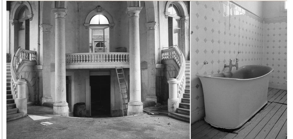
En haut: bains 1896. Dessin aquarellé, Ald. Barriot, 1896. Réalisé pour l'exposition nationale de 1896 à Genève. Restauré en 2017 par Florence Darbre, grâce au soutien de Bernard Russi BOAS Hotels, propriétaire du site depuis 2015. © Ville d'Yverdon-les-Bains, Fonds d'arts visuels, n° 147)