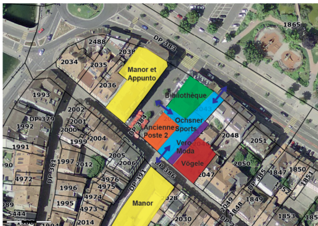
Fig. 1 : Situation générale de l'immeuble sis Place de l'Ancienne-Poste 2